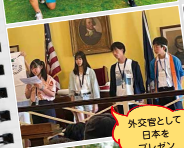
外交官として日本をプレゼン

40名の日米参加者が共に過ごす交流合宿。多様な個性の中で、新しい自分を発見し、「自分らしさ」に磨きをかけます。楽しいアクティビティやアカデミックなディスカッションなど内容も盛りだくさん。プログラムを創るのはあなた自身です! 午前: 文化・語学クラス / 午後: プレゼンテーション、アクティビティ