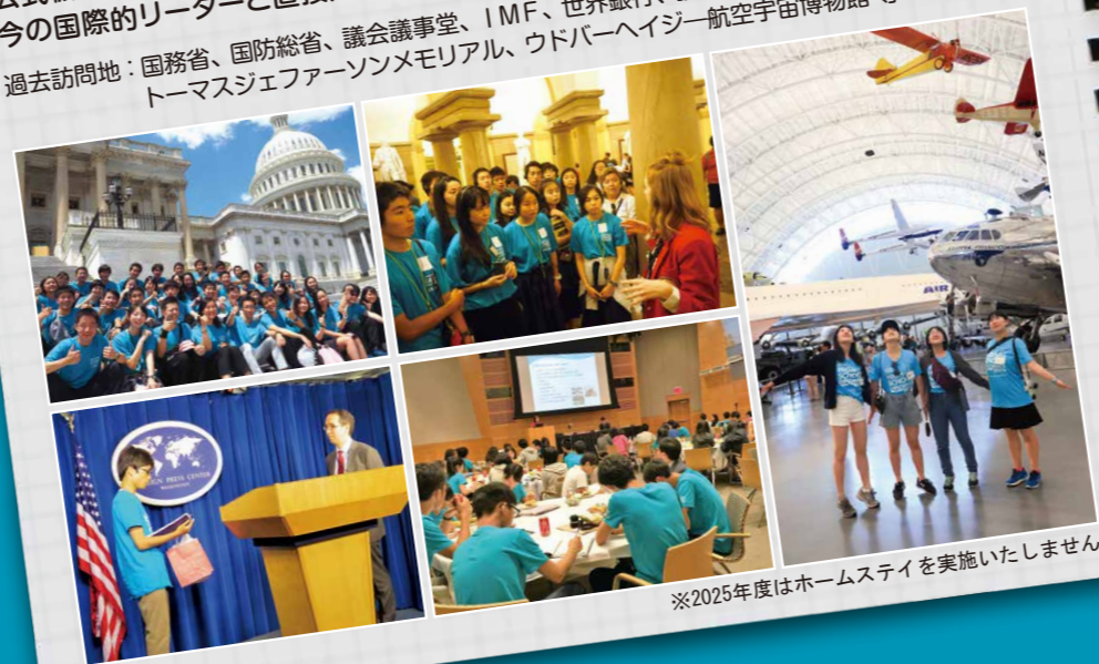
※2025年度はホームステイを実施いたしません

Tour (ワシントンD.C. etc.) 政治・歴史・経済・文化について、多角的な視点からアメリカへの理解を深めます。公式機関への訪問では、高校生外交官として担当者と英語で質疑応答を行います。今の国際的リーダーと直接対話ができるチャンスがたくさん用意されています。 過去訪問地: 国務省、国防総省、議会議事堂、IMF、世界銀行、議会図書館、アーリントン墓地、トーマスジェファーソンメモリアル、ウドバーヘイジー航空宇宙博物館等