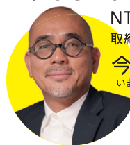
NTTアーバンソリューションズ総合研究所 取締役 街づくりデザイン部長