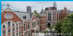
慶應義塾大学三田キャンパス