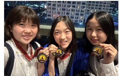
▲World Scholar's Cupにて