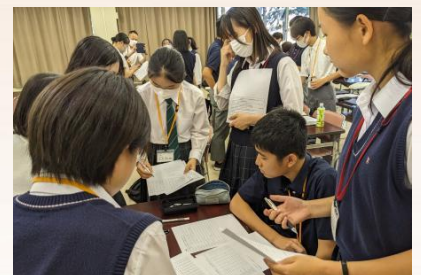
◀夏季集中研修の様子

世界大会に参加したことや、プレゼンテーションについて学んだことが、現在の大学での学習に生かされていると感じます。