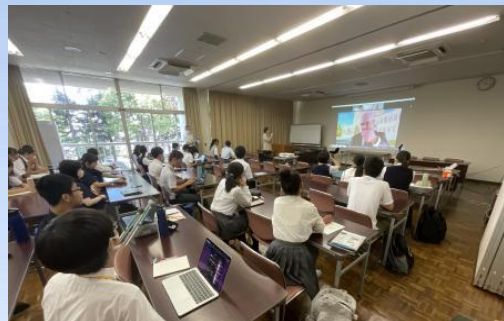
▲夏季集中研修でオーストラリア大学教員の英語講義を受講