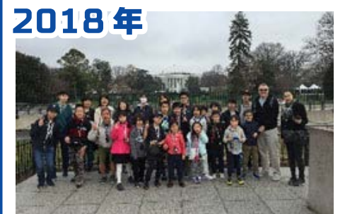
2018年 ケネディ宇宙センターとワシントンDC(スミソニアン)