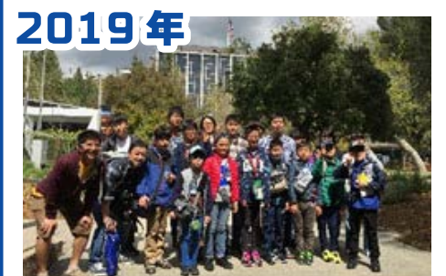
2019年 ケネディ宇宙センターとロサンゼルス(JPL)