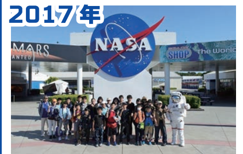
2017年 ケネディ宇宙センターとジョンソン宇宙センター

■旅行企画・実施 (株)イー・ホリデーズ(観光庁長官登録旅行業1839号/JATA正会員) ■受託販売 (株)スペースゲート(東京都知事登録旅行業第3-6947号) 〒101-0054 東京都千代田区神田錦町2-9 大新ビル503号 TEL: 03-5244-5771 FAX: 03-5259-8024 E-Mail: info@spacegate.co.jp (担当: 稲田)